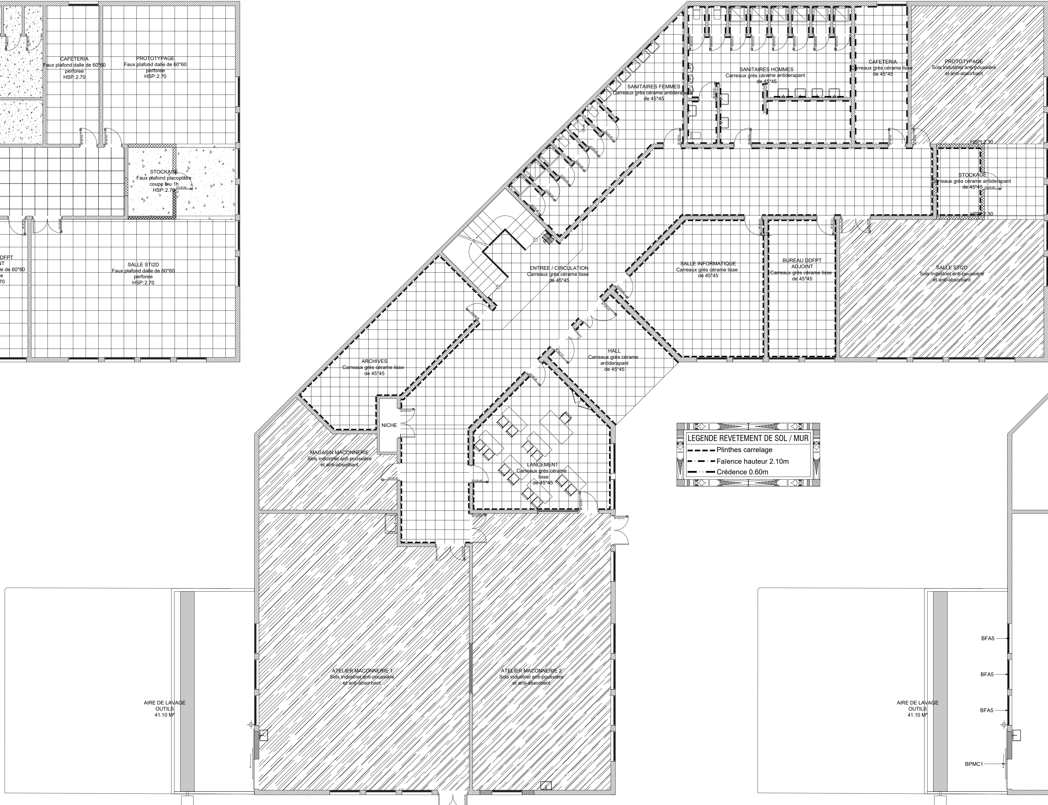
SCHEMA DE PRINCIPE DES REVETEMENTS SOLS & MURS